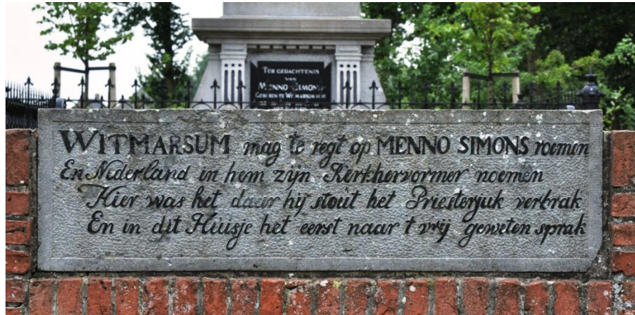
Gedenksteen op het 19e eeuwsw monument in Witmarsum

deze vredelievende mennonieten of menisten werden zwaar vervolgd: enkele duizenden werden er geëxecuteerd (meestal op de brandstapel), anderen vluchtten naar Noord-Duitsland of Polen. Hoewel ook Menno voortdurend op de vlucht was, slaagde hij erin overal weer gemeentelieven te organiseren. Hij is de eerste en de enige (radicale) hervormer van Nederlandse bodem.