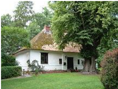
Menno-kate in Bad Oldesloe, waar Menno Simonsz min of meer veilig voor vervolgingen aan zijn geschriften kon werken. Nu is er in het huisje een klein museum aan hem gewijd.

Er is een netwerk van alle plaatsen in Europa waar doopsgezinden leven of leefden. Een touristische route verbindt al die plaatsen in Zwitserland, Frankrijk, Duistland, Nederland, Polen en Oekraïne. Zie de uitvoerige informatie op eumen.net .