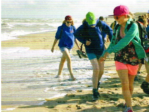
De zomerkampen , al een eeuw lang geliefd bij de jongeren

en de Gemeentedagbeweging zorgt dan voor een verdieping van het geloofsleven. Hieruit zouden ook de broederschapshuizen voortkomen en activiteiten voor jongeren (zomerkampen!).