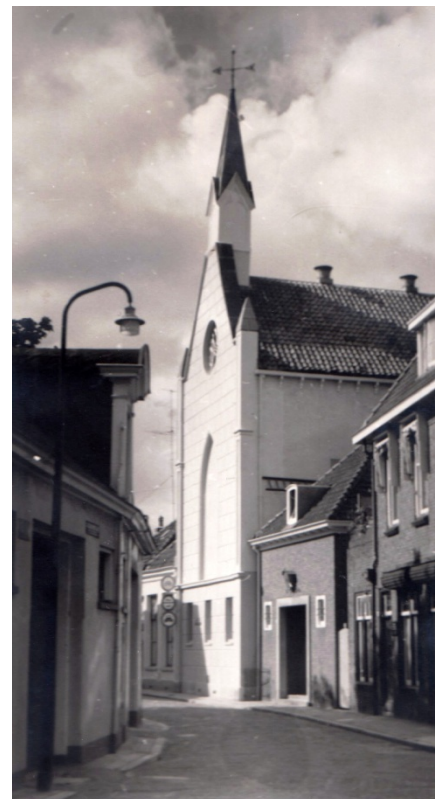
De na de stadsbrand herbouwde kerk de Stadsgravenstraat, die tot 1971 in gebruik was

Deze kerk ging bij de grote stadsbrand van 7 mei 1862 in vlammen op. Op dezelfde plaats werd een nieuwe kerk neergezet, die in 1864 in gebruik werd genomen.